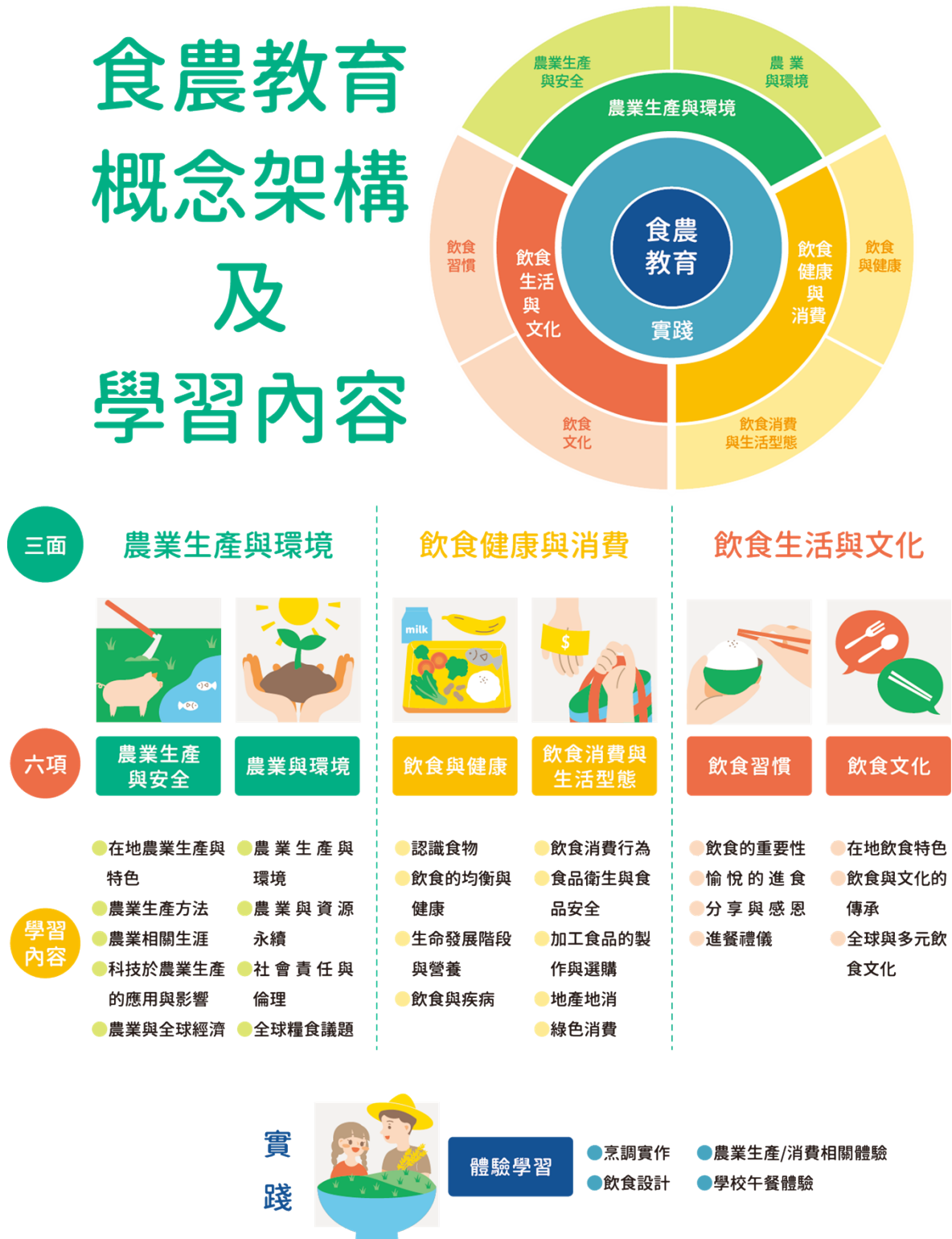
圖 1 食農教育 ABC 模式：食農教育三面六項

資料來源：林如萍，食農教育之推展策略（一）：學校教育實施之概念架構分析，106 年度國立臺灣師範大學產學合作計畫研究報告，頁 28。