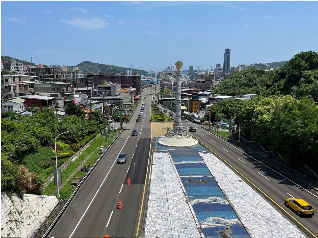
圖 1 國道 1 號北端基隆起點國道地標華表及遠眺基隆港