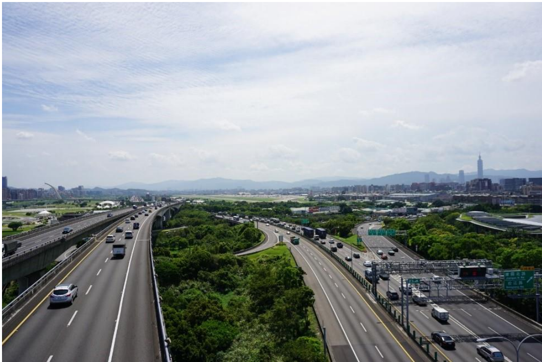
圖 2 國道 1 號臺北盆地都會路段可欣賞臺北地標 101 建築