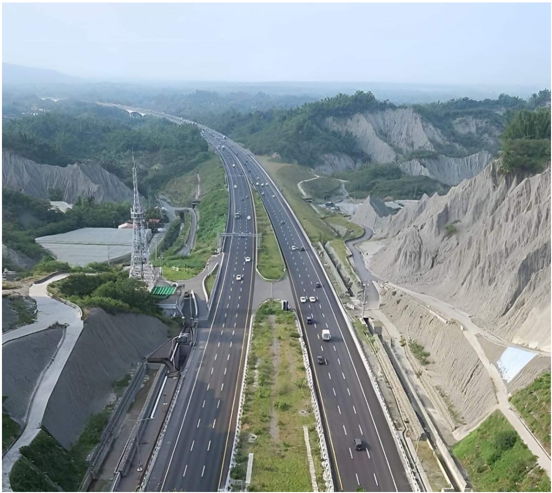
圖 8 國道 3 號中寮路段青灰岩惡地泥岩地質