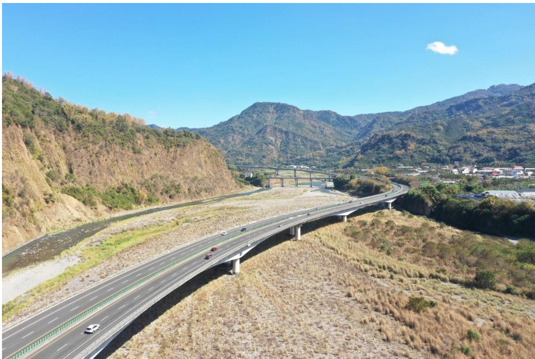
圖 6 國道 6 號雙冬高架橋穿越婉轉秀緻烏溪曲流段及綺麗的九九峰