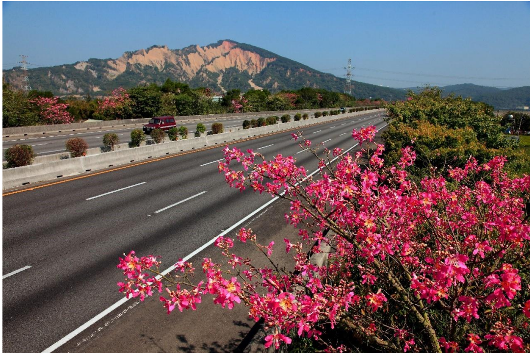
圖 5 國道 1 號苗栗泰安路段美人樹花開為蕭瑟的火炎山增添色彩