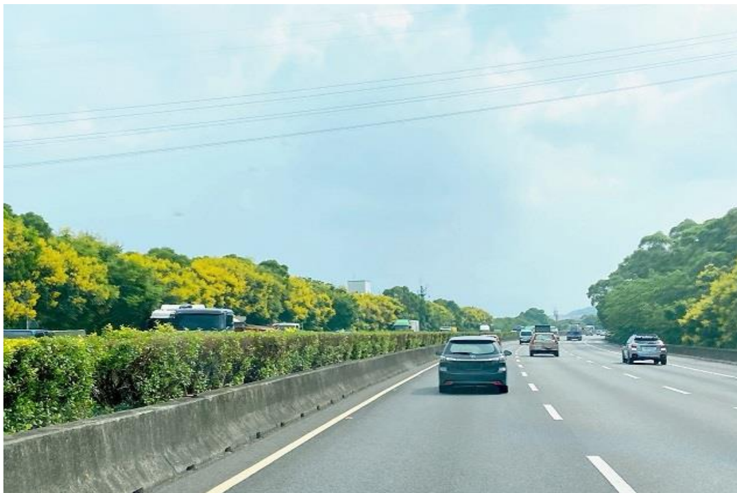
圖 3 國道 1 號桃園台地路段臺灣樂樹開花照片