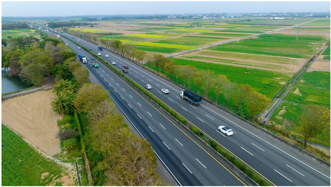
圖 7 國道 1 號嘉南平原新營路段印度紫檀與路外農田相互呼應